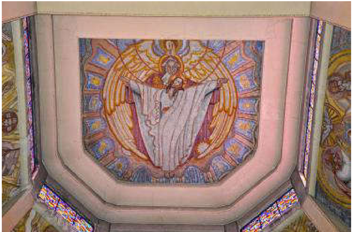
Trinité : Saint Jean Bosco - 75020