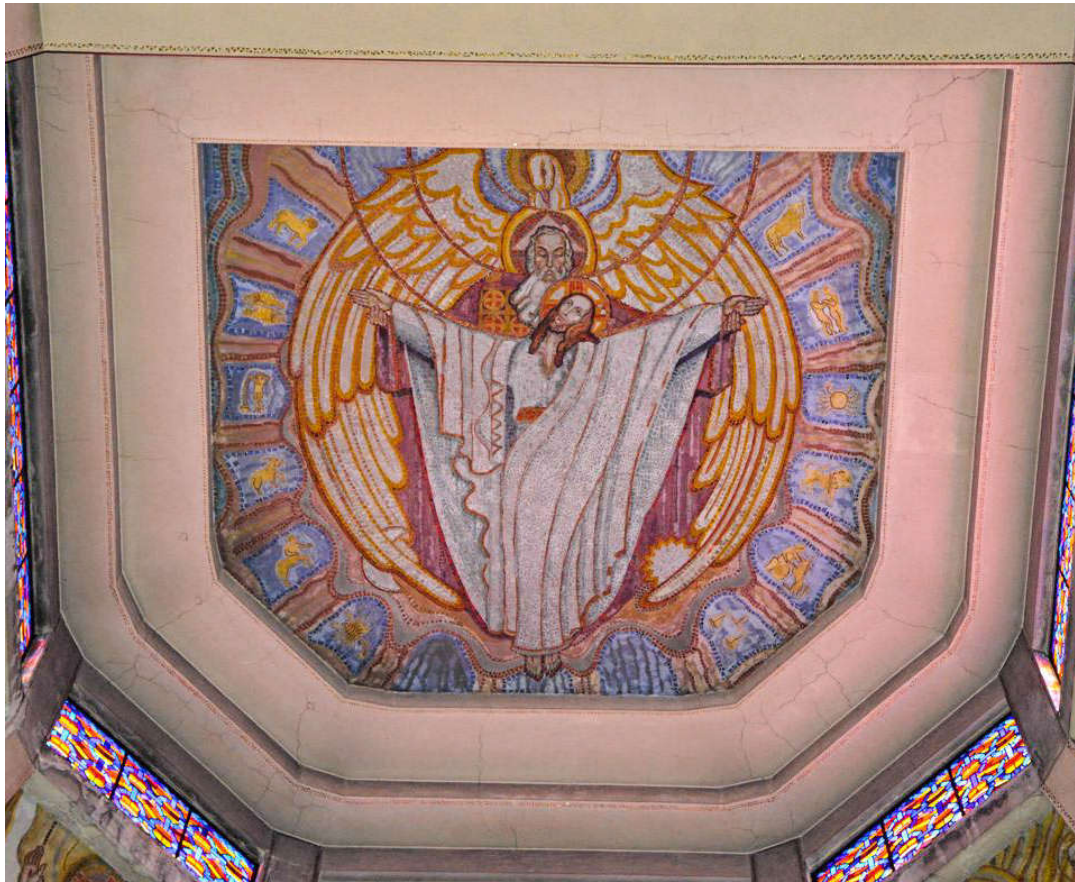
Trinité – Eglise Saint Jean Bosco

6. Vous son peuple, (bis) Vous ses prêtres, (bis) Vous ses serviteurs, (bis) Bénissez votre Seigneur ! ®