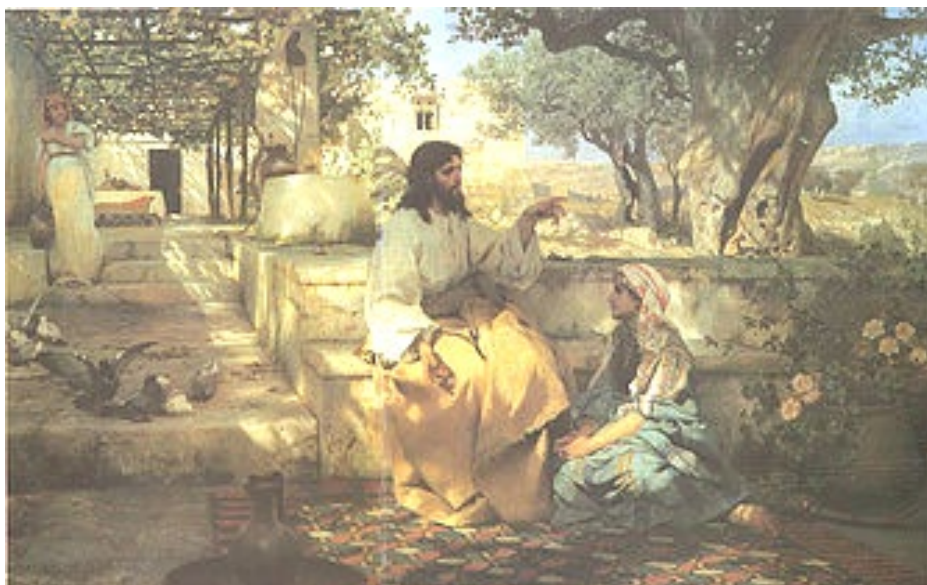
"Marie a choisi la bonne part." Luc 10.42 "Jésus aimait Marthe, et sa soeur, et Lazare." Jean 11.5

Christ aujourd'hui nous appelle, Christ aujourd'hui nous envoie, Vive le Seigneur qui nous aime, Dieu nous donne sa joie. (bis)