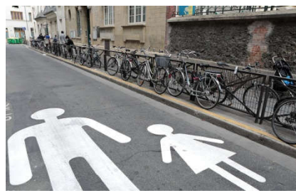
participation à la campagne « la rue aux écoles »

Lieu : 81, rue Alexandre Dumas 75020 Paris