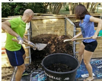
Transfert du compost,